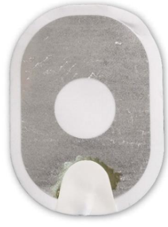
Figur 3: Gel næsten helt adskilt fra bagbeklædningen.

Handling: Sæt elektroder på patienten. Tøv ikke.