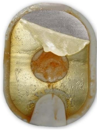
Figur 2: Separeret, foldet gel kan også have et misfarvet og/eller smeltet udseende.

Handling: Sæt elektroder på patienten. Tøv ikke.