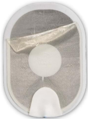
Figur 1: Separeret gel, der har foldet sig sammen, da elektroden blev trukket af.

Det er også muligt, at gelen kan adskille sig næsten helt fra skum-/tinbagbeklædningen, når bagsiden trækkes af (se figur 3 ). På grund af en lille geloverfladekontakt med huden kan der opstå elektrisk buedannelse, når der gives stød, som medfører forbrændinger af patientens hud, eller AED'en kan være ude af stand til at levere stød gennem elektroderne. Der vil opstå en forsinkelse i behandlingen, mens brugeren installerer en ekstra elektrodekassette (hvis tilgængelig) eller udfører HLR, mens der ventes på, at der ankommer personale fra akutberedskabet. Til sammenligning viser figur 4 en normal elektrode. Uanset elektrodens tilstand skal du følge talemådelserne, da AED'en vil føre dig gennem de nødvendige handlinger.